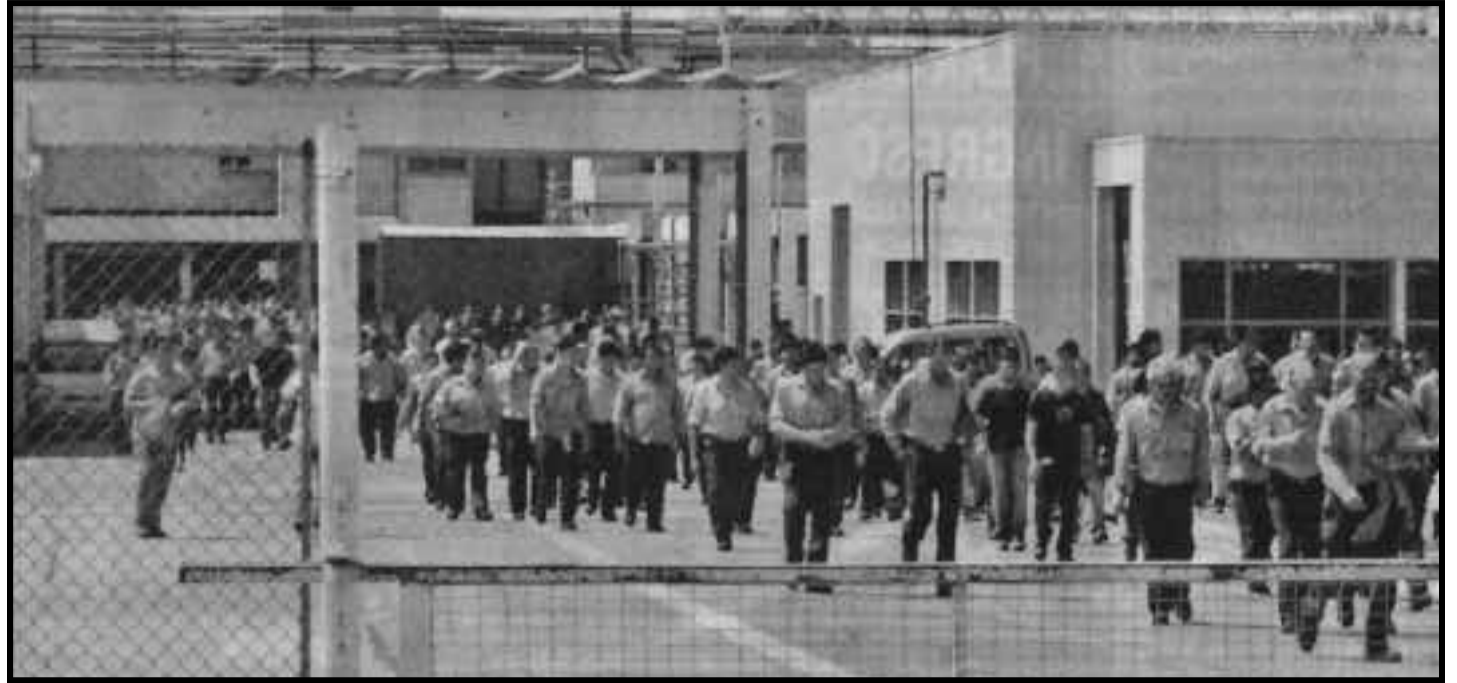
Trabajadores de la Renault en Córdoba

La clase obrera argentina necesita una nueva dirección revolucionaria internacionalista. Nuestro programa y nuestras débiles fuerzas aún, están al servicio de que la clase obrera viva y enfrente el ataque de los capitalistas en Argentina, América Latina y el mundo entero. Somos un punto de apoyo para que se reagrupen los más perspicaces, combativos y avanzados