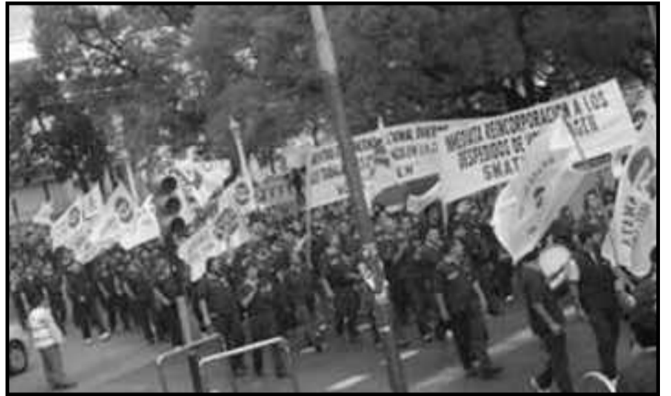
Movilización de los trabajadores de Volkswagen en Córdoba

Así, en el acta acuerdo firmada entre el SMATA y la patronal en el Ministerio de Trabajo, la General Motors " se comprometió a no echar gente, sino a suspenderlos en forma rotativa hasta fines de 2009. Cada operario trabajará un 25%