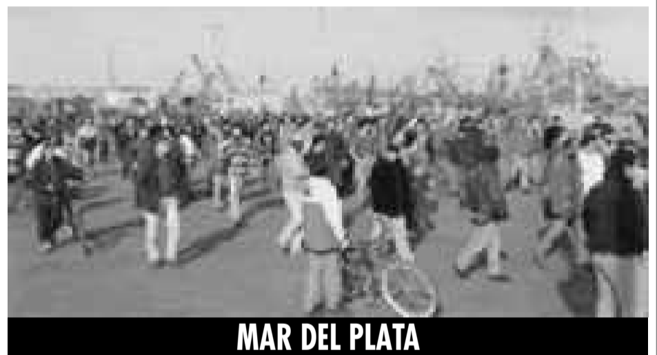
MAR DEL PLATA

Fueron justamente Villaola y la CTA los que aislaron a los trabajadores de Barillari y garantizaron que la toma de la planta fuera en completa soledad y con poca organización, dejando a los compañeros a merced de la represión. Y encima decían que la policía era "amiga" y que garantizaban el corte en J. B. Justo, ¡la misma policía que nos reprimió siempre, nos arrebató el SOIP y que