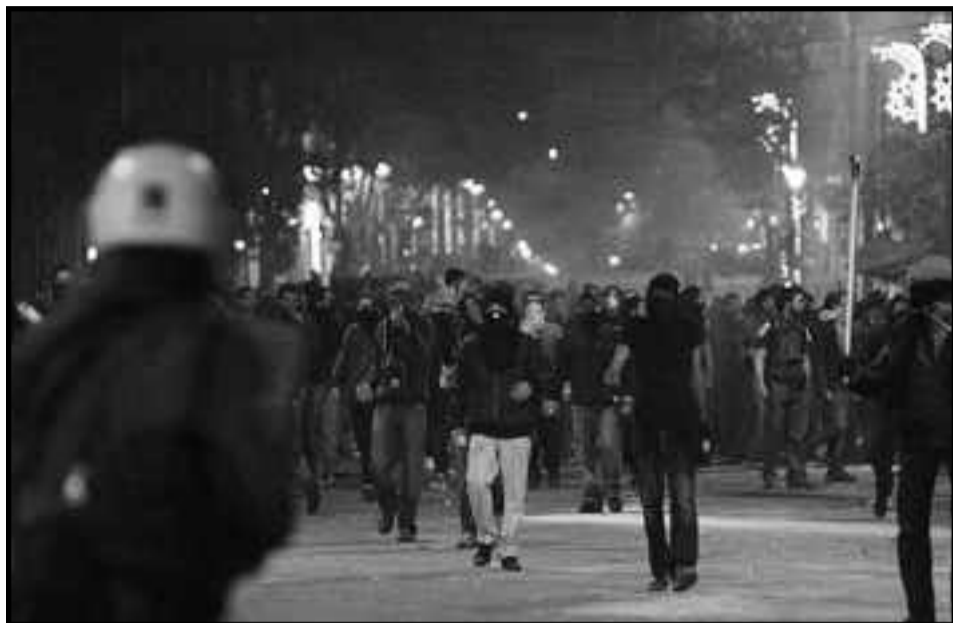
Enfrentamientos durante la revuelta obrera y juvenil en Grecia

Con esta revuelta generalizada, la clase obrera y los explotados de Grecia logran así irrumpir antes de que la crisis, el ataque del capital, el chantaje de la burguesía y la traición de las direcciones que tiene a su frente, desorganice y divida sus filas. Se abre