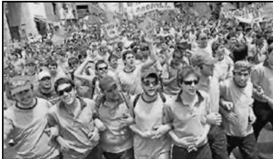
Movilización de trabajadores del SMATA

Si se agranda el ejército de los desocupados con los despidos a mansalva que han comenzado y si no resurge el auténtico movimiento piquetero, el que luchaba por trabajo digno para todos, por el reparto de las horas de trabajo y contra los despidos, como en Mosconi y Central C6, la burocracia sindical tendrá las manos libres para entregar las paritarias, como lo han hecho, de forma vergonzosa, los pistoleros y la mafia de los sindicatos petroleros que por seis meses, "para que no haya despidos", se comprometen a que no haya paritarias, ni luchas por