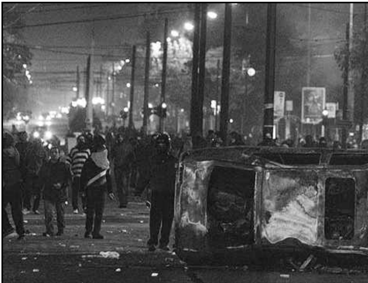
Grecia: con barricadas y lucha en las calles la juventud obrera y los estudiantes combativos enfrentan el ataque de los capitalistas

La clase obrera griega ha tomado la avanzada y mostrado el camino para parar el ataque de los capitalistas. Con revueltas, barricadas, huelga general y lucha política de masas se está abriendo el camino al derrocamiento