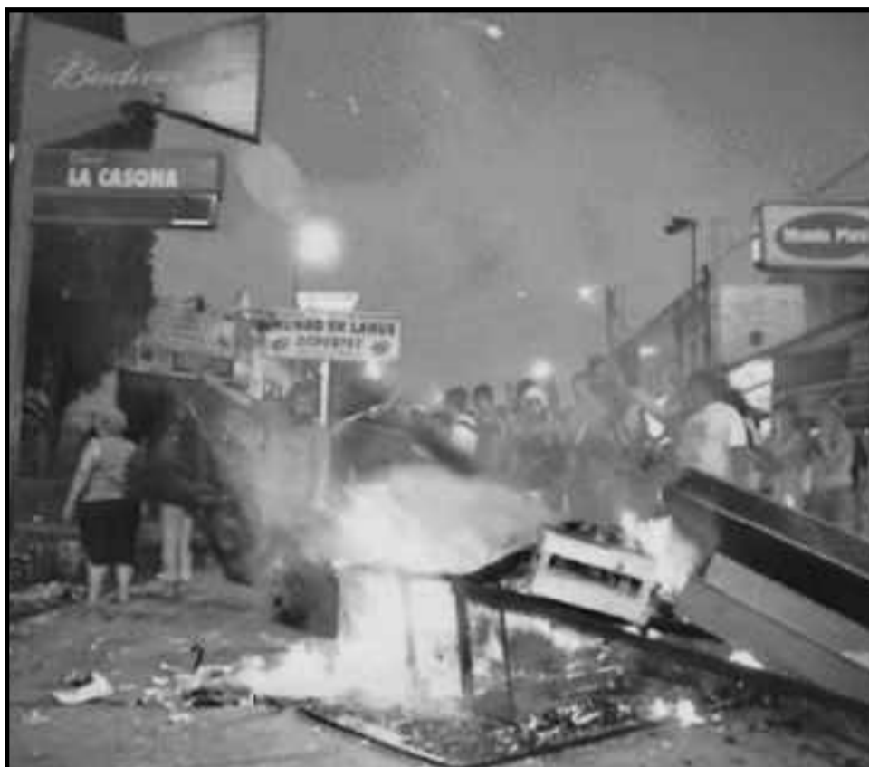
Protesta frente a "La Casona" un boliche de Lanús tras el asesinato de un joven a manos de la seguridad del lugar

¡Basta de verso! ¡Detrás de toda esta gran obra de teatro esconden la más brutal represión a la juventud trabajadora! ¡Cínicos! Todos ellos discuten como "salvar a la juventud perdida", mientras que son ellos: los patrones, sus políticos, el gobierno de los Kirchner y su yuta asesina del "gatillo fá-